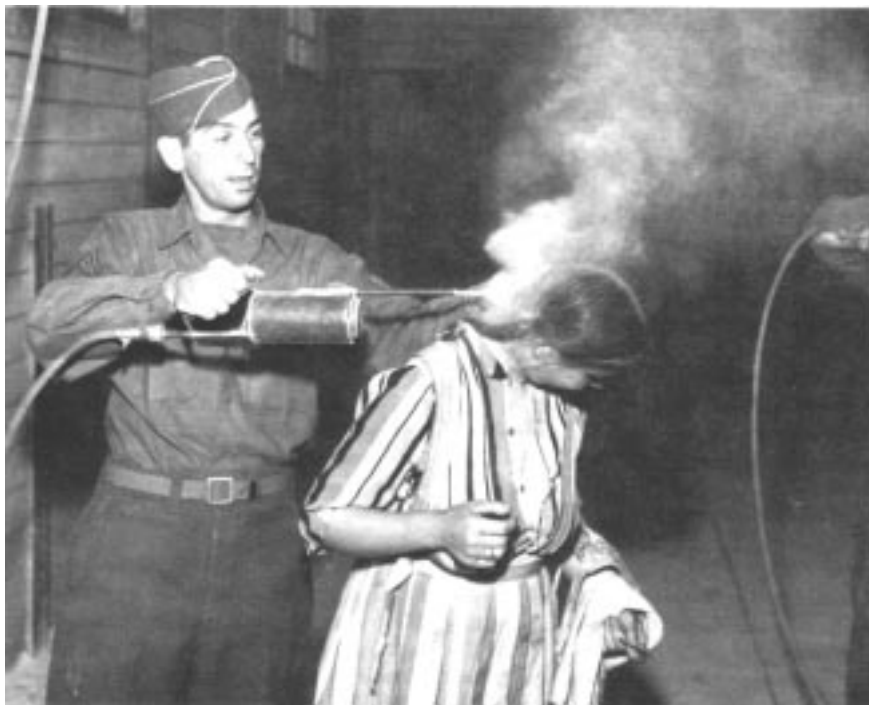
1945: Ejército de los Estados Unidos realizando desinfecciones masivas en la frontera entre Francia y Alemania.

IPEN considera a la Convención de Estocolmo como una promesa de la comunidad global de tomar acciones que protejan la salud humana y el medio ambiente alrededor del mundo, protegiéndolos de los daños que los contaminantes orgánicos persistentes causan. Después de una semana de arduo trabajo de los gobiernos, ONGs y otras organizaciones de la Sociedad Civil,