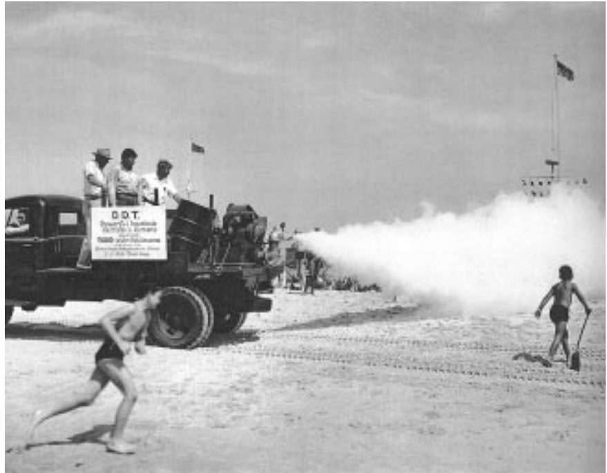
El cartel en el camión dice: "DDT poderoso insecticida, inofensivo para los seres humanos"

Los argumentos que apoyan el perfeccionamiento y la aplicación de este principio son varios. Primero: los productos que han causado daños irreversibles al ambiente, al ser humano o a la