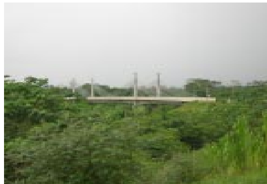
FIGURA 2. CONFLICTO AMBIENTAL EN LA REGIÓN TRINACIONAL DEL MAP. Puente internacional sobre el Río Acre, uniendo la localidad de Iñapari, departamento de Madre de Dios, Perú (izquierda) y Assis Brasil, estado de Acre, Brasil (derecha).

Otros conflictos han girado alrededor de obras de infraestructura internacional. En el caso de la región amazónica compartida entre Madre de Dios (Perú), Acre (Brasil) y Pando (Bolivia), conocida como MAP (en referencia a las iniciales de esos departamentos y estado), los debates se enfocaron en dos puentes internacionales, conexiones carreteras y sus impactos ambientales y sociales (Fig. 2;