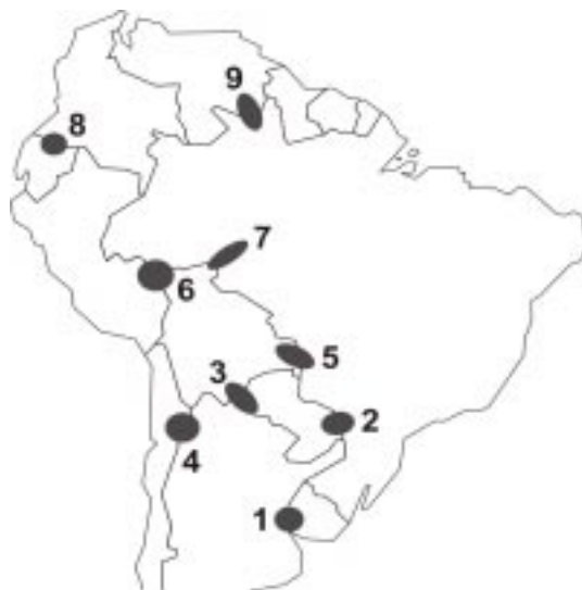
FIGURA 1. SELECCION DE CONFLICTOS AMBIENTALES EN ZONAS DE FRONTERA. 1 Argentina – Uruguay: planta de celulosa en el Río Uruguay; 2 Paraguay – Brasil: represa de Itaipú; 3 Argentina – Bolivia – Paraguay: alto Río Pilcomayo; 4 Argentina – Chile: minería en Pascua Lama; 5 Bolivia – Brasil: minería en El Mutún; 6, Bolivia, Perú y Brasil: puentes internacionales y carreteras en la región del MAP; 7 Brasil – Bolivia: represas sobre el Río Madeira; 8 Ecuador – Colombia: fumigación en la frontera; y 9 Venezuela – Brasil: tendido de transmisión eléctrica.

Estos conflictos envuelven la gestión de ecosistemas compartidos, sea por un uso conjunto, o por impactos transfronterizos. Varios conflictos se desenvuelven alrededor de un río o una cuenca compartida. Es muy conocida la disputa entre Argentina y Uruguay por la instalación de una planta de celulosa en la mar-